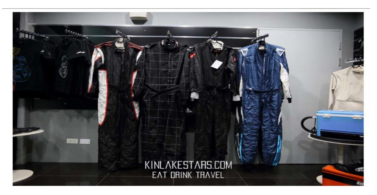
พอบรีฟเสร็จแล้วเราจะไปฝากของไว้ที่ล้อคเกอร์ มีกุญแจ้ไว้ให้คล้องข้อมือค่ะ ใส่ชุดเครื่องแบบที่ทางสนามได้จัดเตรียมให้ ใส่หมวกใส่ชุดให้เรียบร้อย พร้อมลงสนาม

ซึ่งก่อนหน้านั้น เราก็สามารถนั่งเล่นสั่งเครื่องดื่มรอไปก่อน หรือ ขึ้นไปขั้น 2 ของอาคารเพื่อถ่ายรูป สนามได้ รอจนเจ้าหน้าที่เรียกเข้าไปทำความเข้าใจ เกี่ยวกับระบบความปลอดภัยของสนามและเตรียมตัวลงสนามกันได้เลยค่ะ